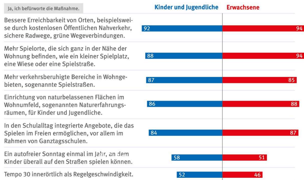
Abbildung 10: Maßnahmen zum besseren Spielen